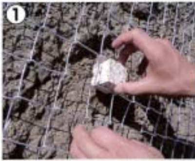
① ブロックを金網に通す