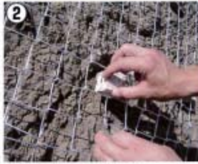
② ブロックの切れ目を金網素材に入れる