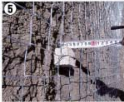
⑤ ブロック高 4.5 cm