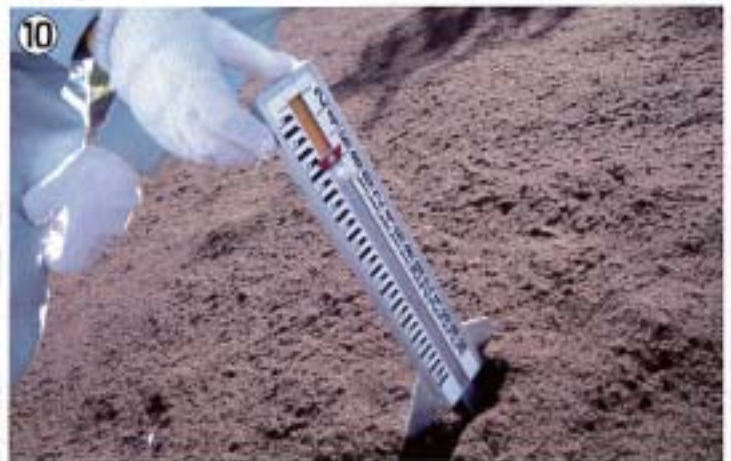
⑩ 吹付厚さ t=5.0 cm