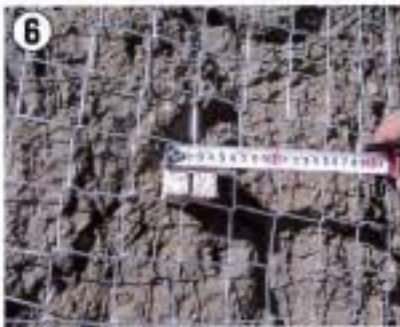
⑥ ブロック幅 4.5 cm