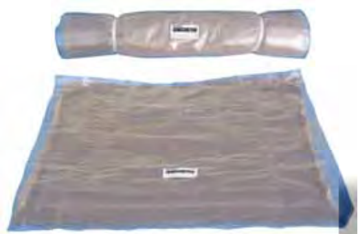
特別配合の製作も行っております